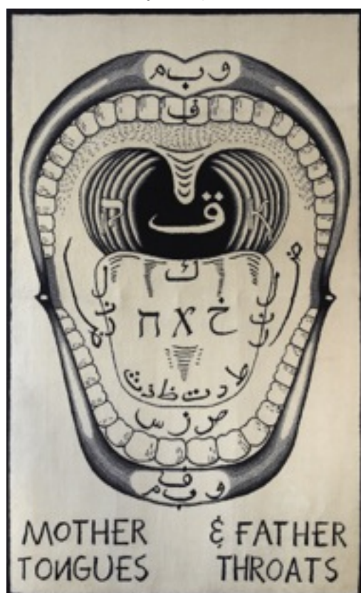
Slavs & Tatars, „Języki macierzyste i ojcowskie gardła”, dywan, 300 × 490 cm, 2012 Kolekcja Muzeum Sztuki Nowoczesnej w Warszawie

W swojej praktyce artystycznej kolektyw Slavs and Tatars zajmuje się obszarem geograficznym i kulturowym rozciągającym się od dawnego muru berlińskiego na zachodzie do Wielkiego Muru Chińskiego na wschodzie. W projektach grupy zderzone zostają pojęcia i problemy z pozoru przeciwstawne lub do siebie nieprzystające: islam i komunizm, metafizyka i humor czy popkultura i geopolityka. Pochodzące z kolekcji Muzeum prace Slavs and Tatars szczególnie skupione są na problematyce języka. Przykładem obiektu zatytułowany „Języki macierzyste i ojcowskie gardła” poświęcony głosce „Khhhhhhh”, która nie występuje w zachodnim obiegu cywilizacyjnym i tym samym wyraźnie oddziela Wschód od Zachodu. Z kolei „PrayWay”, nawiązująca do znanego ze wschodnich baśni motywu latającego dywanu, to typowa dla grupy interaktywna i relacyjna praca polegająca na stworzeniu miejsca spotkania i rozmowy, międzykulturowej komunikacji i wymiany myśli.