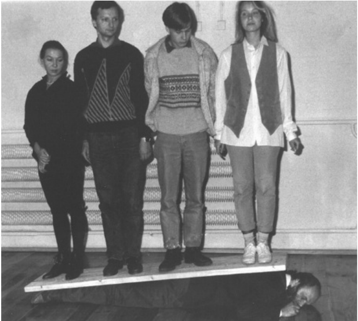
Paweł Kwiek, „Modlitwa”, dokumentacja performansu (fragment), 1990

„Modlitwa” to fotograficzna dokumentacja dwuczęściowego performansu Pawła Kwieka. W części pierwszej artysta leżał na ziemi a na nim stała grupa osób. W drugiej części ta sama grupa osób utrzymywała artystę w górze. W obu sytuacjach Kwiek odmawiał modlitwę. Przekaz pracy był bardzo egzystencjalny: obojętnie czy jestem na górze czy na dole, czy mi się powodzi czy nie, modlę się, jestem sobą, zachowuję swoją duchową tożsamość.