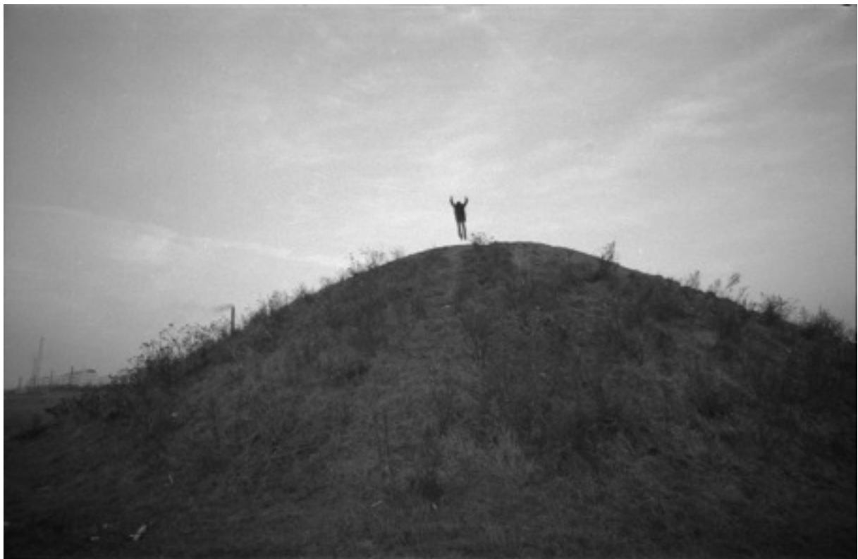
Zbigniew Warpechowski, „Modlitwa o Nic”, fotografia, 1974

W „Modlitwie o Nic” artysta wykonuje tytułową czynność w niezwykłym zawieszeniu „pomiędzy niebem a ziemią”. Artysta w latach 70. poświęcił swoją sztukę w znacznej mierze badaniu pojęcia „Nic”. Odsyłało ono według niego do sfery absolutnie czystej, bezinteresownej i pozbawionej jakichkolwiek funkcji czy pragmatycznych użyć, podobnie zresztą jak pojęcia „Sztuka” czy „Absolut”. Ponadto praca ta była specyficznym, ironicznym odniesieniem się Warpechowskiego do nadmiernego skupienia artystów neoawangardowych na analizach mediów, na autotematycznych pracach z wykorzystaniem fotografii i filmu.