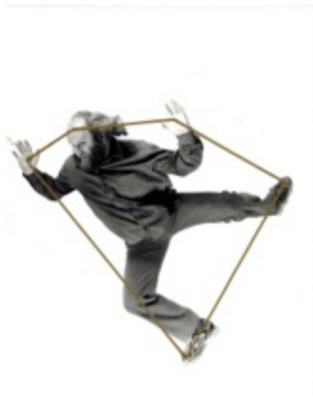
Paweł Kwiek, z serii „Spotkania ze światłem”, fotografia, 21 × 29,7 cm, 1991

„Spotkania ze światłem” pokazują Kwieka przybierającego różne ekspresyjne pozy i miny skonstrastowane z naniesionymi na fotografię barwnymi figurami mającymi oznaczać sacrum. Artysta początkowo odgrywał do obiektywu aparatu fotograficznego różne przeżycia mające oznaczać subiektywne uczucia i traumy. Później naniósł na te pozy kolorowe formy mające wyobrażać "obiektywizm form boga". Tematem pracy jest konfrontacja subiektywnego z obiektywnym czyli spotkanie ze światłem / iluminacja.