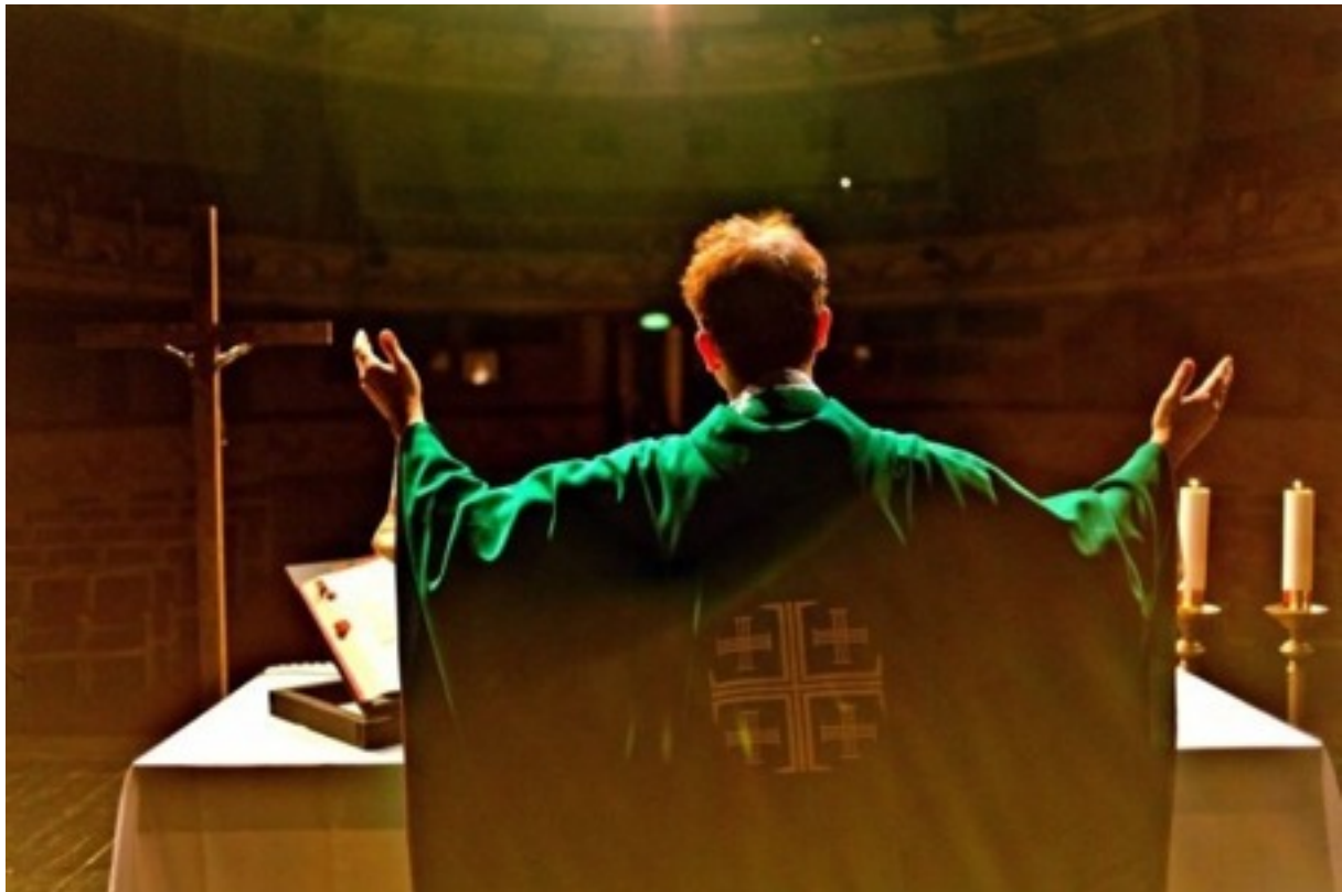
Artur Żmijewski, „Msza”, kadr z filmu, 2011

Film dokumentuje przygotowania do wystawienia teatralnej wersji Mszy Świętej w Teatrze Dramatycznym w Warszawie, z profesjonalnymi aktorami w rolach głównych. Celem Żmijewskiego była analiza performatywnych cech tego „najczęściej wystawianego przedstawienia w Polsce”. Mimo, iż „Msza” powielala 1:1 kościelny rytuał, jej przeniesienie do sfery świeckiej sprawiło, że cel – przemienienie ciała i krwi Chrystusa poprzez słowa modlitwy - nie został osiągnięty. Tomasz Terlikowski określił akcję Żmijewskiego jako „sakralną bezalkoholową wódkę” – zestaw słów i gestów bez duchowego działania.