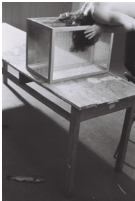
Zbigniew Warpechowski, „Autopsja”, dokumentacja performansu, 1974

W „Autopsji” artysta wkłada głowę do akwarium, z którego przed chwilą wyjął rybę i położył na blacie obok. Widzowie obserwowali skutek tej zamiany ekosystemów – duszenie się artysty i symultaniczne duszenie się ryby. Akcja Warpechowskiego była w jego zamyśle filozoficzno-poetycką przestrogą - podobnie jak ryba nie przeżyje zanurzenia w iluzorycznej, pojęciowej wodzie – tak ludzie nie przeżyją długo w pozornie racjonalnej rzeczywistości, która powoli wysysa z nich życie, duchowość, człowieczeństwo, nie jest ich właściwym „ekosystemem”. Prowokacyjna akcja Warpechowskiego, wywołując protesty oraz trudne do zniesienia napięcie wśród widzów, miały ich oburzać i wybijać z konwencjonalnego oglądu rzeczywistości, kierować ich wyobraźnię i odczuwanie poza widzialny, racjonalny, pragmatyczny świat społecznych relacji.