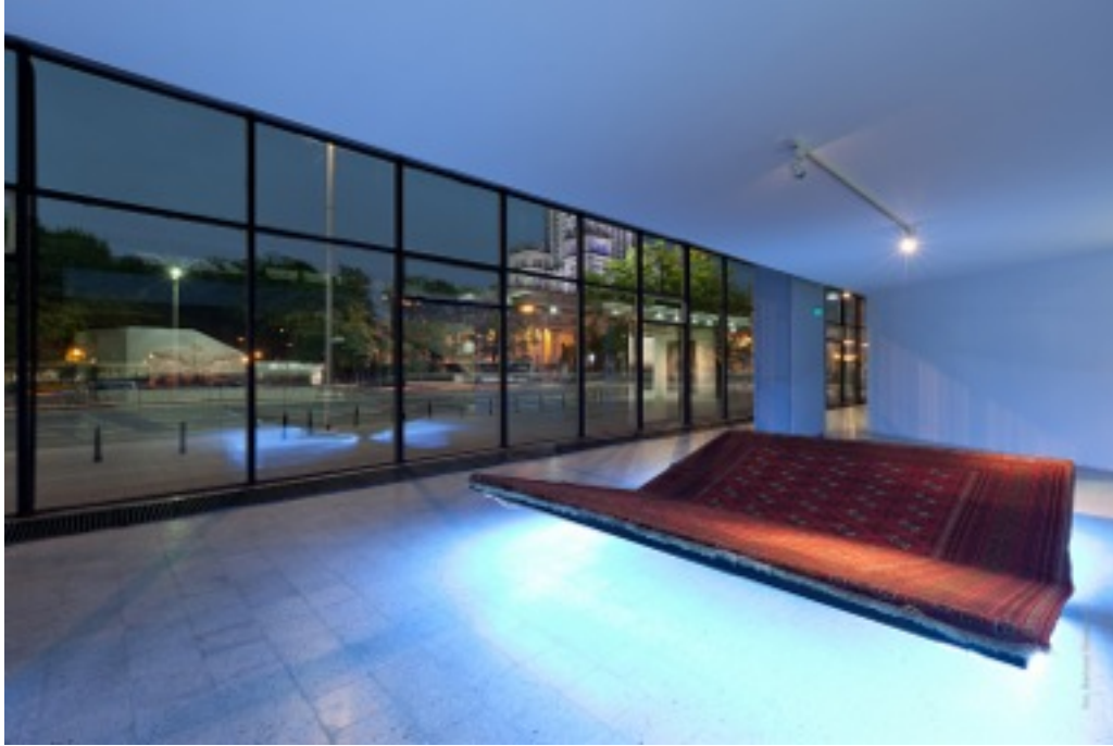
Slavs & Tatars, „PrayWay”, dywan, płyta MDF, stal, jarzeniówki, 390×280×50 cm, 2012 Kolekcja Muzeum Sztuki Nowoczesnej w Warszawie