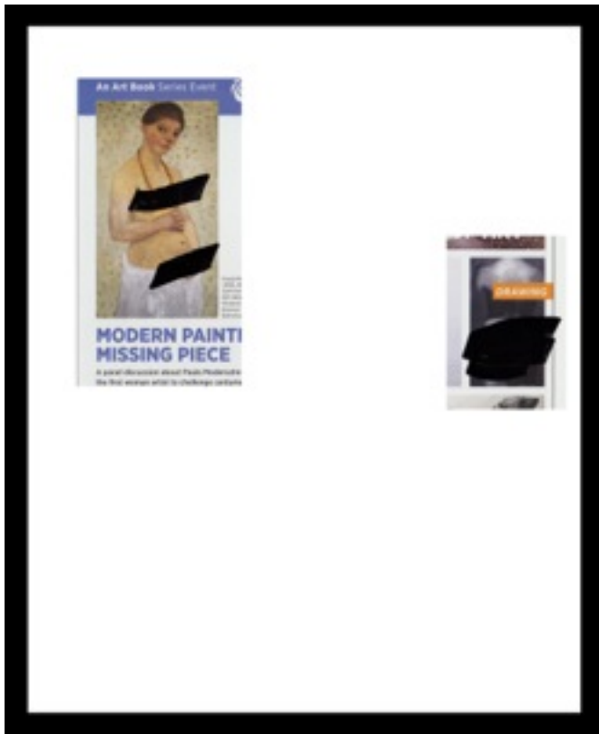
Fayçal Baghriche, seria „Przyjazne dla rodziny”, technika własna, 38 cm x 43.5 cm, 2012

„Przyjazne dla rodziny” to seria składająca się z ilustracji wyciętych z zachodnich pism artystycznych, znalezionych przez artystę w Dubaju. W Zjednoczonych Emiratach Arabskich, tak jak w innych krajach muzułmańskich, obrazy nagości nie są dozwolone w sferze publicznej i dlatego muszą być ręcznie zamalowywane przez cenzorów, przez co każdy z nich staje się unikatowy. Baghriche zestawiając zdjęcia z dwóch różnych egzemplarzy tego samego pisma, analizuje społeczne i estetyczne znaczenia tych hybrydowych obrazów.