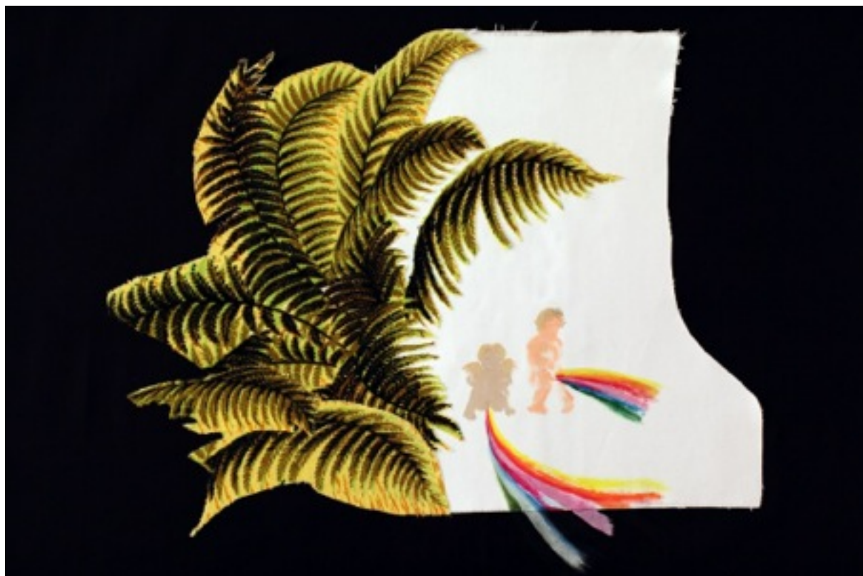
Nilbar Güreş, Rajskie rzeki, kolaż na tkaninie, 82 × 90cm, 2011

Wyszyty na tkaninie kolaż „Rajskie rzeki” to kolejna manifestacja feministycznych poglądów Güreş. Działając w medium tradycyjnie kojarzonym z kobiecością i ornamentalną perfekcją, artystka w humorystyczny i prowokacyjny sposób odnosi się do koranicznego opisu siedmiu rajskich rzek, prezentując anioły oddające tęczowy mocz.