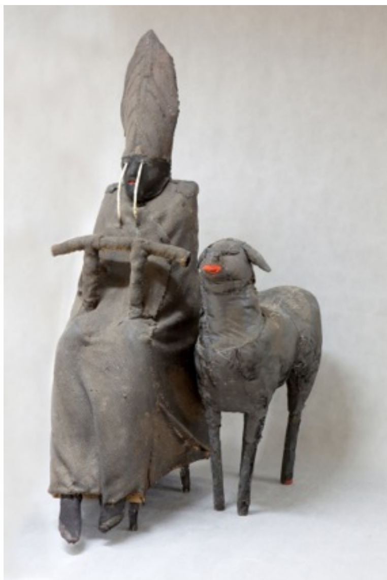
Mirosław Bałka, „Czarny Papież, czarna Owca”, drewno, dywan, tkanina, stal, farba, 161 × 60 × 97 cm, 1987, Kolekcja Muzeum Sztuki Nowoczesnej w Warszawie

„Czarny papież i czarna owca” to jedno z najważniejszych wczesnych dzieł artysty. Naturalnych rozmiarów postaci człowieka-papieża towarzyszy owca. Papież płacze, z jego oczu symbolicznie tryskają strumienie wody. Artysta nawiązał w tym przedstawieniu do przepowiedni Nostradamusa, a także do miejskich legend, wizji i apokaliptycznych przepowiedni, łączących powołanie czarnoskórego kardynała na tron papieski z końcem świata. Praca oddaje stan ducha drugiej połowy lat 80.: niepokoju, napięć, ale i wiary w nadchodzący przełom, który wstrząśnie posadami świata.