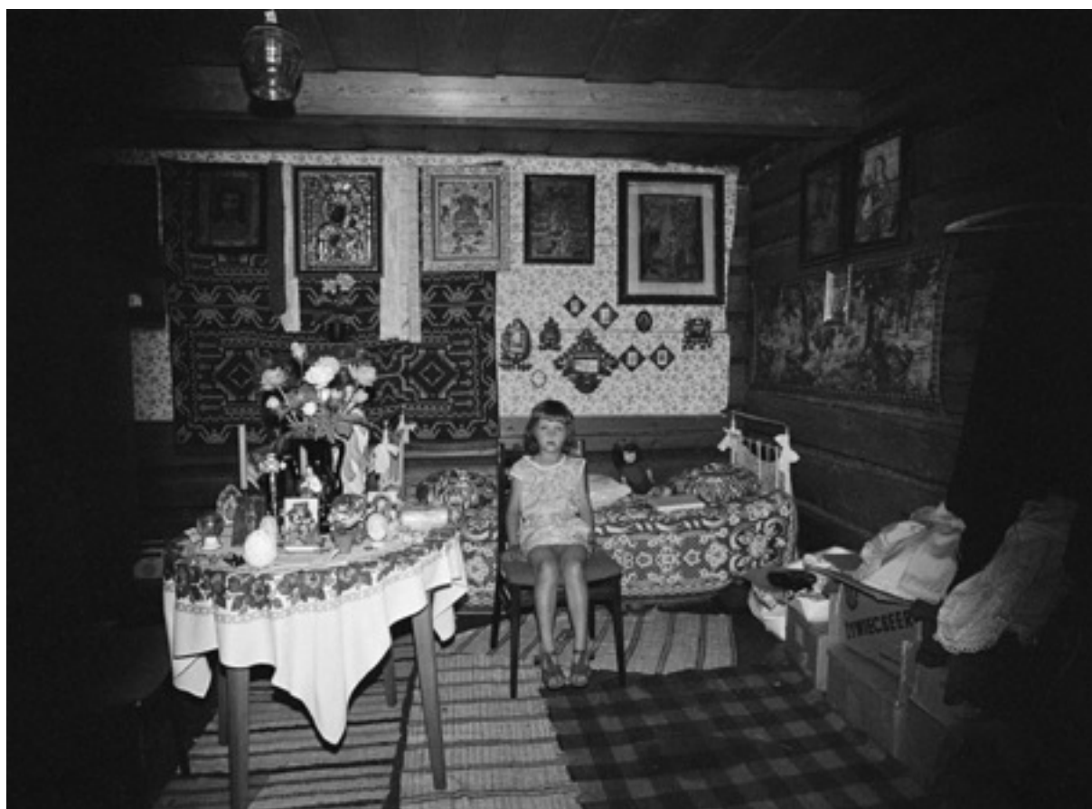
Zofia Rydet, z cyklu „Zapis socjologiczny”, fotografia, 1978–1997

„Zapis socjologiczny” Zofii Rydet jest jednym z najważniejszych dzieł fotografii polskiej XX wieku. Już w wieku bardzo dojrzałym – w momencie sprecyzowania koncepcji Zofia Rydet miała 67 lat – zaczęła tworzyć swoje opus magnum. Na główny trzon całego zbioru – obrazy określane jako ujęcia kanoniczne – złożyły się wizerunki mieszkańców wsi i miast, powstałe w różnych rejonach Polski oraz za granicą. Łączy je ścisły rygor kompozycyjny. Ukazują ludzi – pojedynczo, w parach lub w grupie, na tle wybranej ściany ich mieszkania. Wybór fotografii na wystawę prezentuje zdjęcia eksponujące szczególnie materialne formy kultu religijnego mieszkańców polskiej prowincji.