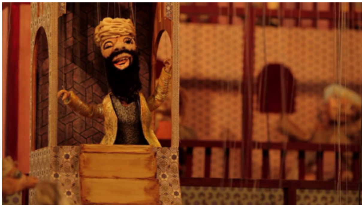
Wael Shawky, „Kabaretowe Krucjaty: droga do Kairu”, kadr z filmu, 2012

Film „Kabaretowe krucjaty: droga do Kairu” jest kolejną odsłoną projektu Waela Shawky’ego poświęconego wyprawom krzyżowym, reinterpretowanym w oparciu o relacje kronikarzy arabskich i arabskie dokumenty historyczne. Źródłem scenariusza jest książka Amina Maaloufa „Wyprawy krzyżowe w oczach Arabów”. Godzinny film obejmuje wydarzenia rozgrywające się na przestrzeni 48 lat, od zakończenia pierwszej wyprawy krzyżowej w 1099 roku do rozpoczęcia drugiej, w 1147. Film utrzymany jest w konwencji kukiełkowego przedstawienia z elementami musicalu, programu popularnonaukowego, bożonarodzeniowych jasełek, a nawet horroru.