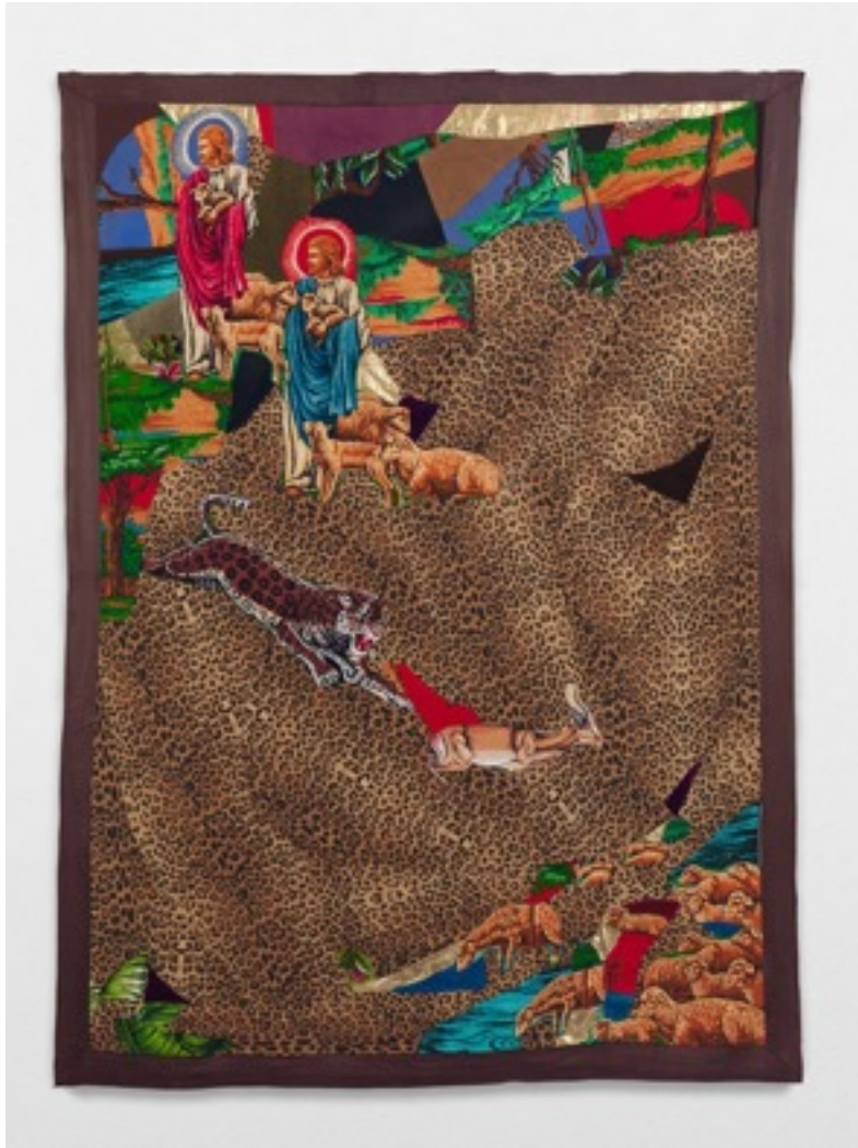
Gülsün Karamustafa, „Podwójny Jezus i mała antylopa”, kolaż na tkaninie, 185 × 230 cm, 1984

Karamustafa wykonała swój kolaż z łatwo dostępnych, kiczowatych tkanin naściennych o tematyce religijnej, dostępnych w latach 80. w Turcji na niemal każdym bazarze. Artystka odwołuje się w tej pracy do sytuacji mieszkańców przedmieść Stambułu i innych wielkich miast, którzy od lat 70. masowo emigrowali z terenów wiejskich i w nowym kontekście wykształcili własną, hybrydalną kulturę wizualną.